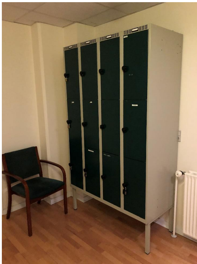
Figur 5 Skabe placeret i flugtvejstrappe. Dette er gældende for flere etager.