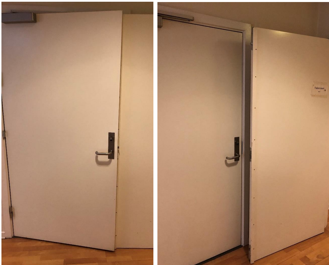
Figur 1 Billede til højre viser hvorledes dør til teknikrum ikke kan lukke i, og holder røgopdelingsdøren.

Ved dør til røgopdeling af flugtvejsgang i stueplan, er der udført en dør til teknikrum der ikke kan lukke i, hvis dør til røgopdelingen er åbnet op. Denne dør er udført med ABDL-anlæg, og vil ikke kunne lukke i, hvis teknikrumsdøren holder den, som illustreret på nedstående billede.