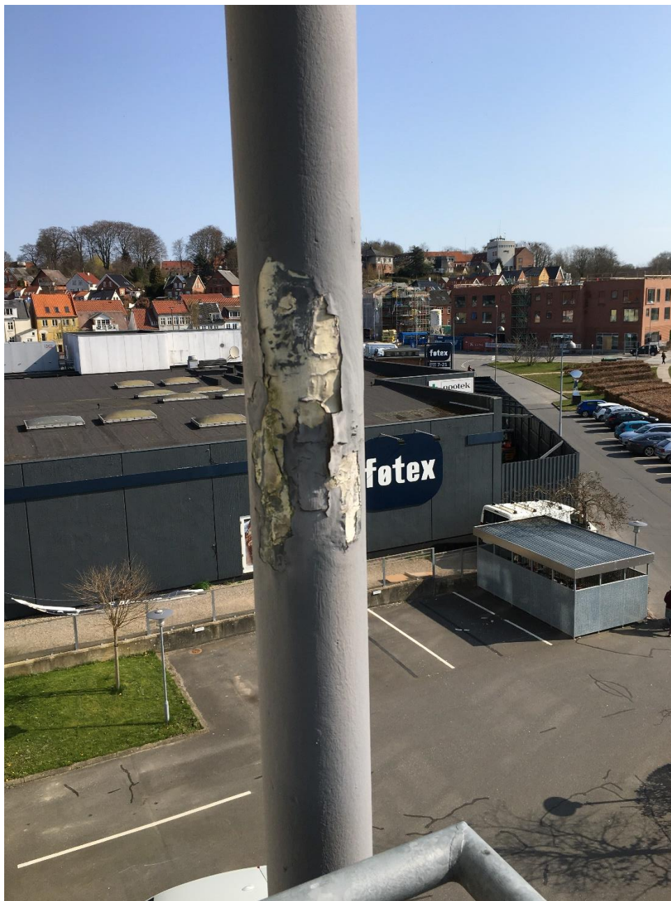
Bærende stålsøjle, som er sikret som bærende konstruktion klasse R 60 med anvendelse af brandmaling. Brandmalingen skal efterses og i nødvendigt omfang repareres.