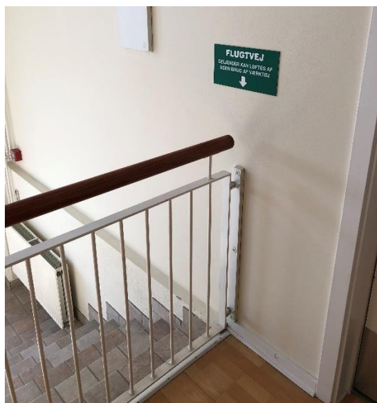
Figur 6 Gelænder ved nedgang til udgang. Gelænderet skal løftes for at kunne passer.

Ved trappenedgang til udgang i stueetagen er der udført en sikring i form af et gelænder der skal løftes og drejes, for at få adgang til trappenedgangen. Dette vurderes at der skal benyttes en kraft for at løfte dette gelænder på mere end 100 N (10 kg), hvilket kan derfor kan være en forhindring for at benytte udgangen.