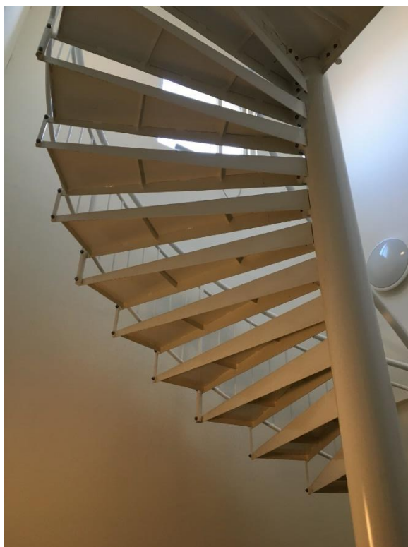
Figur 7 Spindeltrappe der anvendes til flugtvejstrappe

Der er udført en spindeltrappe som flugtvejstrappe. BR95 kap 6.10.2 stk. 2 "Trapper skal udføres, så de giver bequem mulighed for båretransport ". Samt betjener flugtveje hvor gulvoverflade er mere end 5,1 meter over terræn.