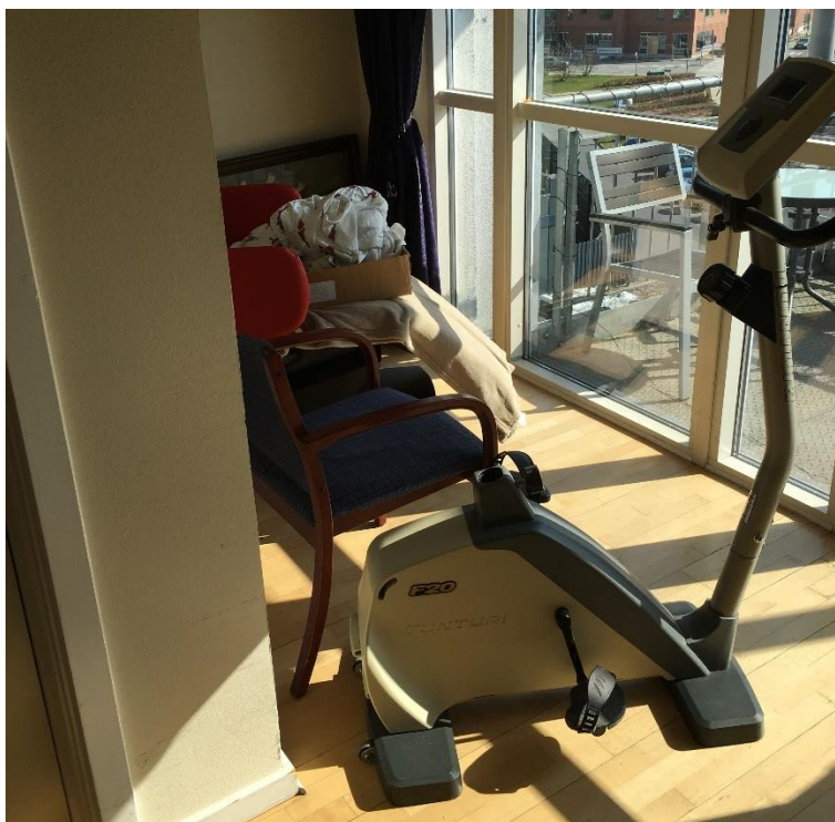
Figur 3 Oplag i flugtvejsgang på 3. sal

Der kunne ved bygningsgennemgang konstateres at der i flugtvejsgange var opstillet møbler, luftrensere og motionsudstyr, desuden var der oplag i hovedtrappen med stole og borde, samt skabe placeret i trapperummet for spindelflugtvejstrappen, hvilke ikke er i overensstemmelse med BR95 pkt. 6.5.1 stk. 1: "Gange kan dog indrettes til formål, som ikke medfører væsentlig forøget brandbelastning eller reducerer gangenes funktion som flugtveje."