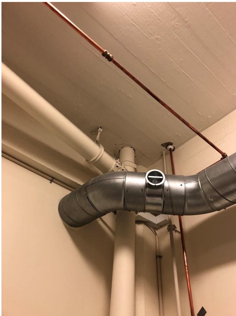
Figur 2: Manglende brandsikring og brandtætning ved faldstammer/afløb udført i plast i kælder

Herunder ses aktuelle eksempler på manglende brandtætning omkring gennemføringer i brandadskillende bygningsdele, manglende brandmæssig adskillelse mellem lokaler i det aktuelle byggeri.