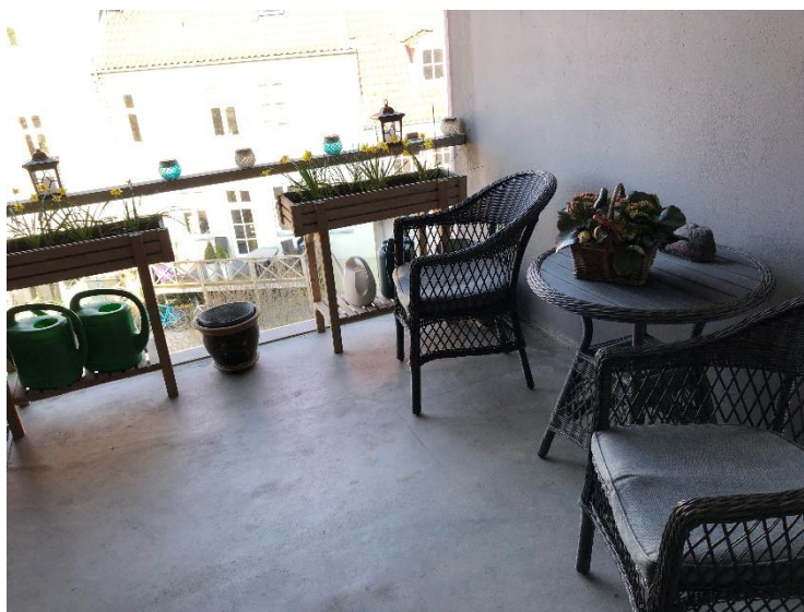
Figur 4 Oplag ved hovedtrappen med stole, borde og beplantning.